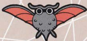
フクロウハカッセー